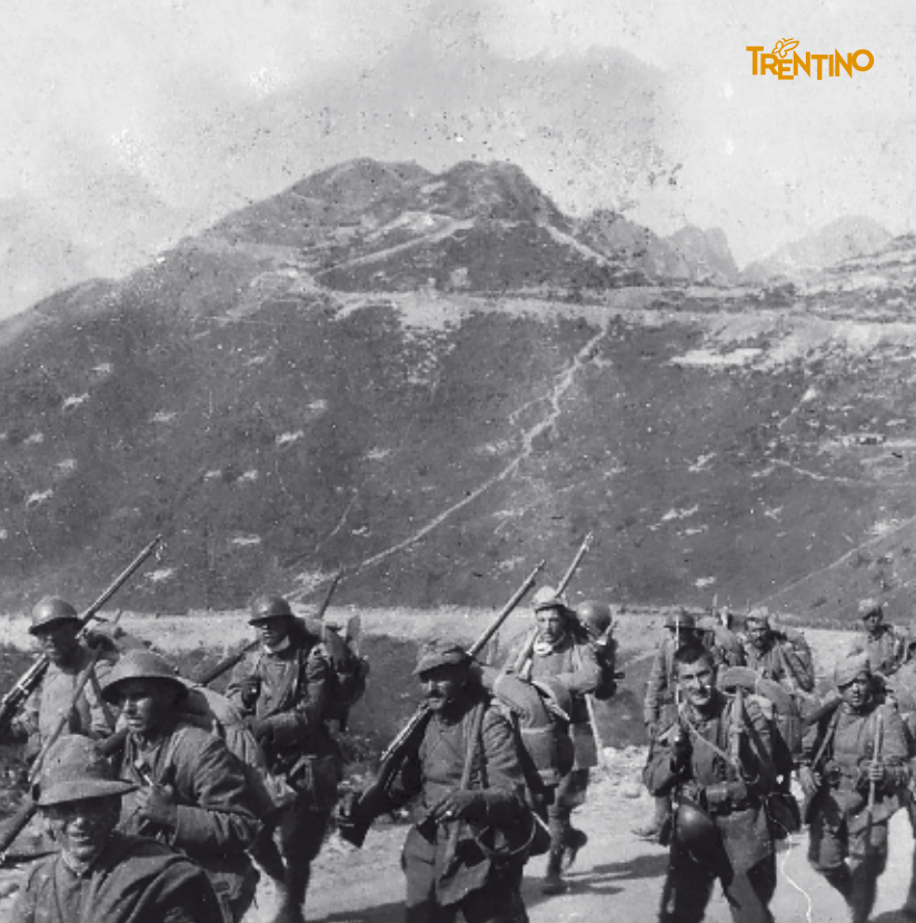
In copertina: Maggio 1918. La 147. Compagnia del Battaglione Alpini Monte Pelmo a passo Buole